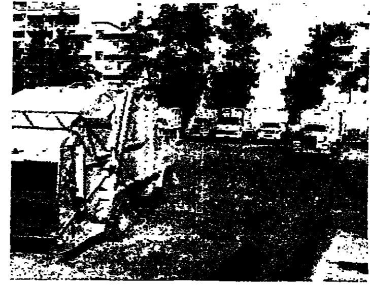
بعض الشاحنات التي لا تزال تعمل

ويتضمن المشروع الفخم انكرا هندسي وسياحية تقترح اقامة مجمعات خيرية وبيوت جديدة تجلس التواب وتؤسسة الحكومة والمركز الوطني ولجنة بيروت وبعض الدوائر الرسمية لتسهيل أعمال المواطنين وتأمين مبدئي شاطيء المنطقة ومراكز تجارية على قران تلك الساحل بمحاذاة اراكي « الثاني سائر » وسما ويبسوس وغيرها .